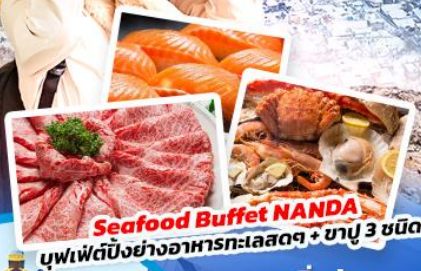
Seafood Buffet NANDA บุฟเฟต์บั้งย่างอาหารทะเลสดๆ + ชาปู 3 ชนิด